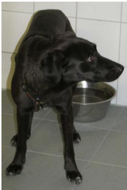
Ronja, ein extrem ängstlicher Hund aus dem Ausland.