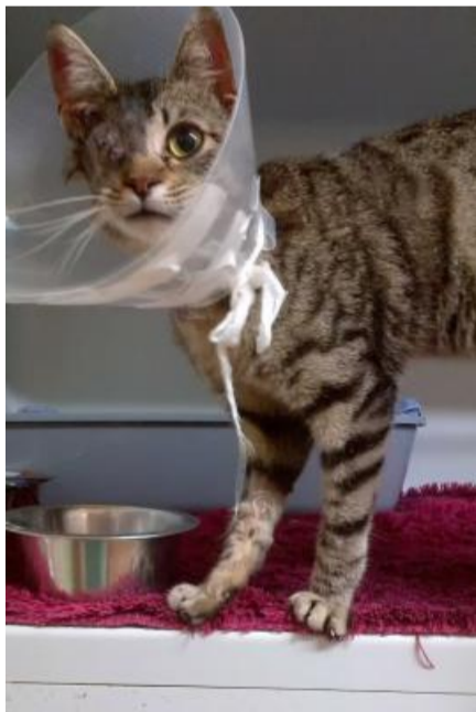
Pepe wurde aus dem Ausland geholt, konnte nicht behalten werden und wurde im Tierheim in sehr viel schlechterem Zustand als mitgeteilt übergeben.