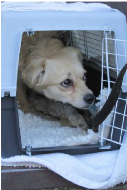
Die dauerpanische Dorela.