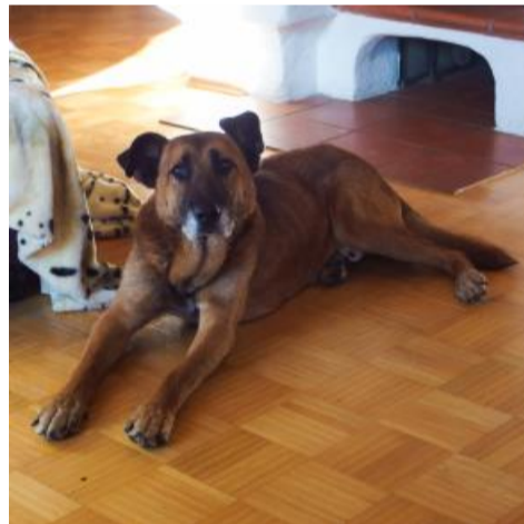
Richie hat einen "Mr. Hyde Moment"