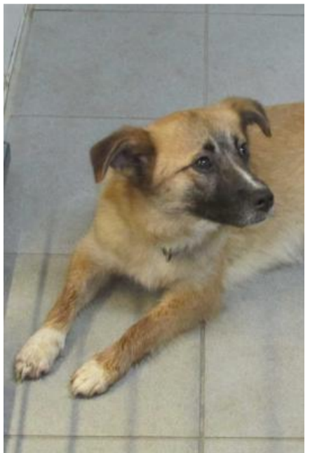
Foxy, die am ersten Tag bei ihren neuen Besitzern gleich weggelaufen ist.